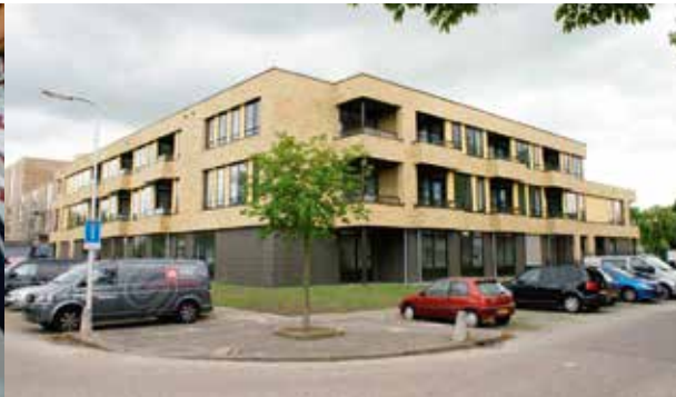
Van links naar rechts, van boven naar onder: Uitleg over de Softform matrassen, Het nieuwe pand van De Wulverhorst in Oudewater, Uitleg over de functionaliteit van de bedden, Les met High Tea tussen de steigers.